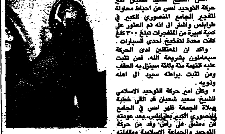
شعبان يلقي خطبه

طرابلس - الأناوار: اعلن الشيخ سعيد شعبان امير حركة التوحيد امس عن احياء محاولة لتفجير الجامع المنصوري الكبير في طرابلس واشار الى انه تم العثور على كمية كبيرة من المتفجرات تبلغ ٣٠٠ كلغ كانت معدة لتفجير إحدى المساجد. واكد ان المعتقلين لدى الحركة سيعاملون بشريعة الله من حيث عليه التهمة منة بالثقة يستلزمه العطف ومن تثبت براءته سيرد الى اهله وتوبه. وكان امير حركة التوحيد الاسلامي الشيخ سعيد شعبان قد التقى خطبة ليلة الجمعة ظهر امس في الجامع المنصوري الكبير بطرابلس بعد عودته من دمشق عن راس وفد من حركة التوحيد والجماعة الاسلامية ومكثته الرئيس السوري حافظ الأسد وكبار المسؤولين السوريين. وقال الذي تزل به القم ويتبع الشيطان ثم يقول ان الله ويهود آل رشده فلن الله غفور رحيم. وحب التواين والمتطهرين والمعتدين ان الهدى. واضاف: ايها المحرمون، ايها الفتاة يا تلامذة الشيطان يا تلامذة اليهود، يا (...). يا اولياء الشيطان، يب التوبة مفتوح امامكم، ولكن عتاب الله سيلاحق لكم على ميعة اليهود (...). ولعنة الله مستلقة بقلته الابرياء للاربن بالشوارع الذاميين ان طلب الرق من الله.